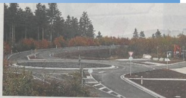
Dieser Kreis ist in den vergangenen Monaten für mehr als eine Dreiviertelmillion Euro auf der Wasserkuppe entstanden. Seit Mittwoch ist er befahrbar und die Sperrung der Straße damit aufgehoben.

Der neue Kreis ist früher fertig geworden als geplant. In den vergangenen Monaten ist er für eine dreiviertel Million Euro entstanden. Jetzt ist der Weg über die „Kupp“ wieder frei befahrbar.